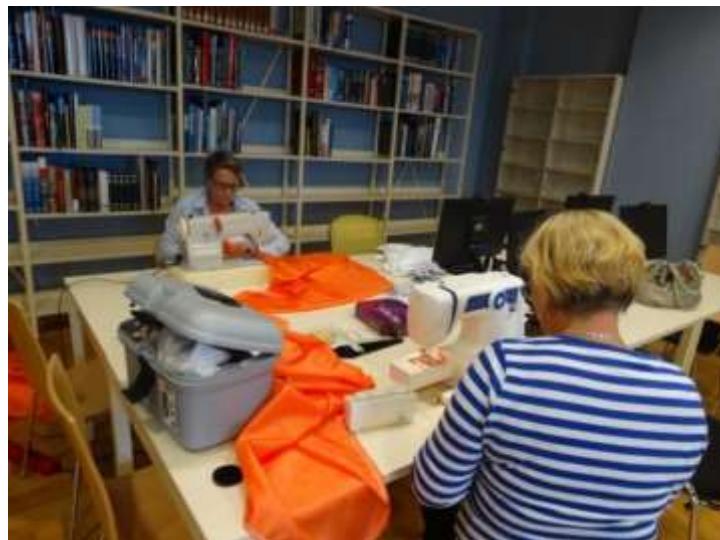
Radionica šivanja rimskih tunika