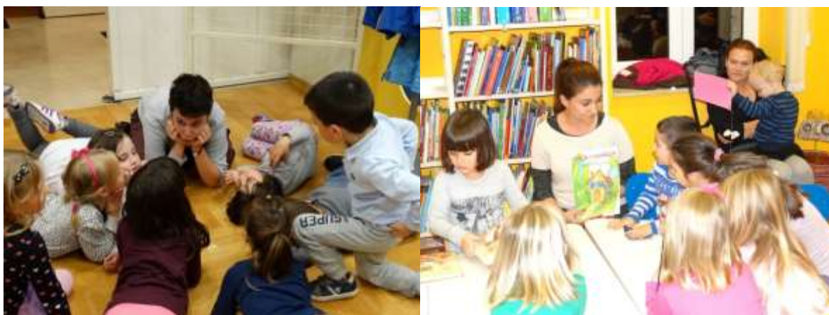
Pričaonice Prijatelji zauvijek i Ivica i Marica

Svakog utorka u 17 sati održavaju se Pričaonice za djecu od tri do šest godina u pratnji roditelja, baka, stričeva, teta. Pričaonice se sastoje od čitanja slikovnice, prepričavanja priče, razvojnih igara i kreativne radionice. Ozračje jest opušteno, ugodno i toplo, a roditelji su u blizini djece i surađuju s njima u radionicama. Sve aktivnosti na Pričaonici zajedno čine tematsku cjelinu temeljenu na priči koja je odabrana za čitanje. Cilj Pričaonica je odmalena poticati čitanje, komunikaciju, razvoj mašte i kreativnosti. Rad s djecom utječe na cjelokupnu zajednicu jer da povećanjem kvalitete njihova života