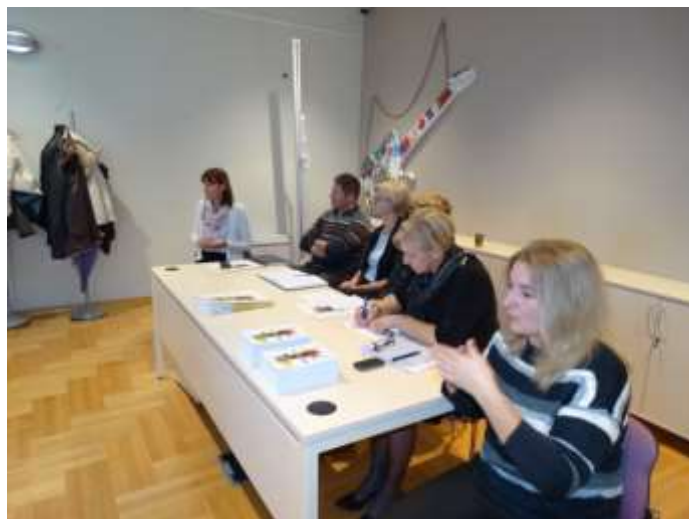
Okrugli stol „Važnost uspostave socijalnih usluga u zajednici“