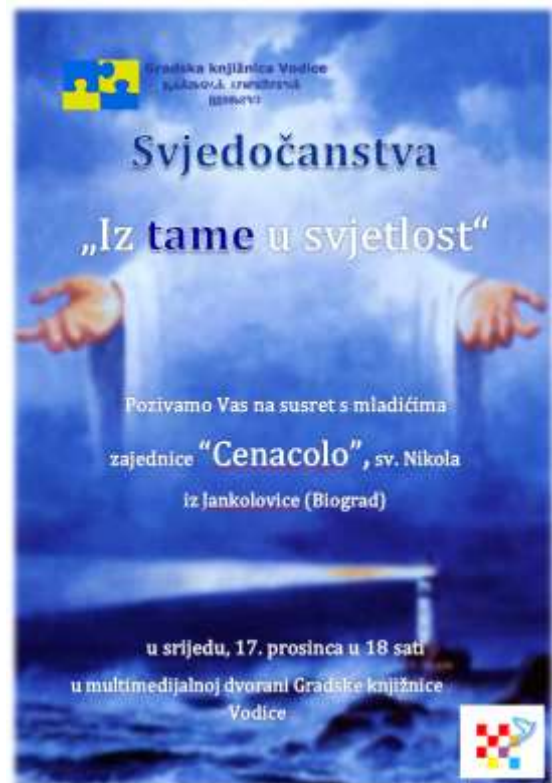
Neki od plakata osmišljeni i izrađeni za događanja u Knjižnici