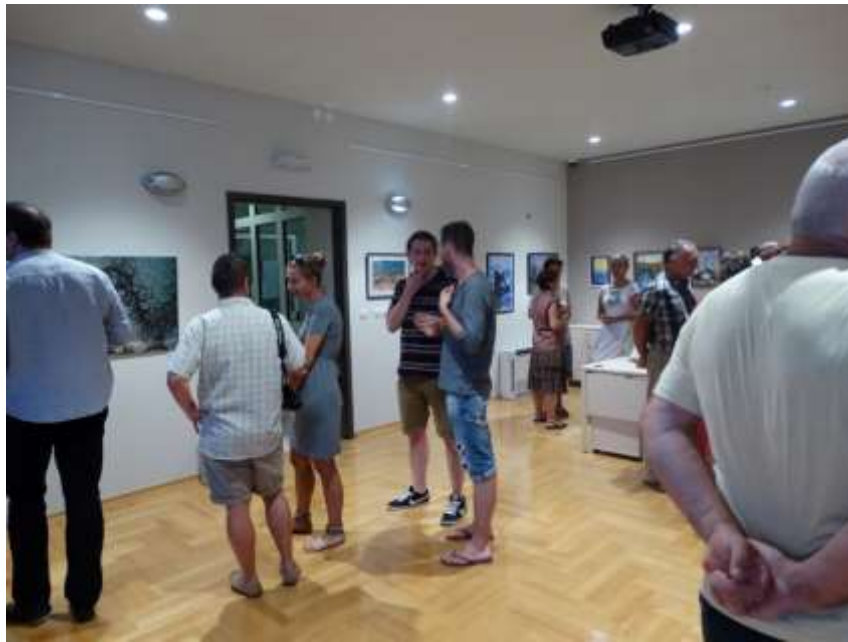
Posjetitelji otvorenja izložbe Plava uspomena

Krajem kolovoza otvorena je izložba fotografija i slika mađarskih umjetnika, okupljenih u likovnoj koloniji "Terasa u Srimi" pod nazivom Plava uspomena .