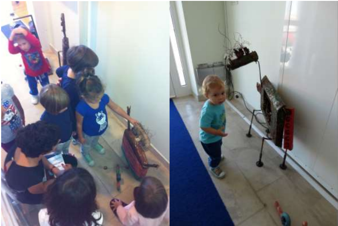
Razgledavanje izložbe Roboti u knjižnici

Već tri mjeseca na Odjelu je smještena izložba instalacija kastavskog umjetnika Saše Jantoleka pod nazivom "Roboti". Instalacije su prošle godine bile dio hrvatskog nastupa na 65. Sajmu knjiga u Frankfurtu koji je u cijelosti bio posvećen knjigama za djecu i mlade. Puževi i roboti su, u međuvremenu, oživjeli u knjizi Kašmira Huseinovića "Puž u neobičnom gradu".