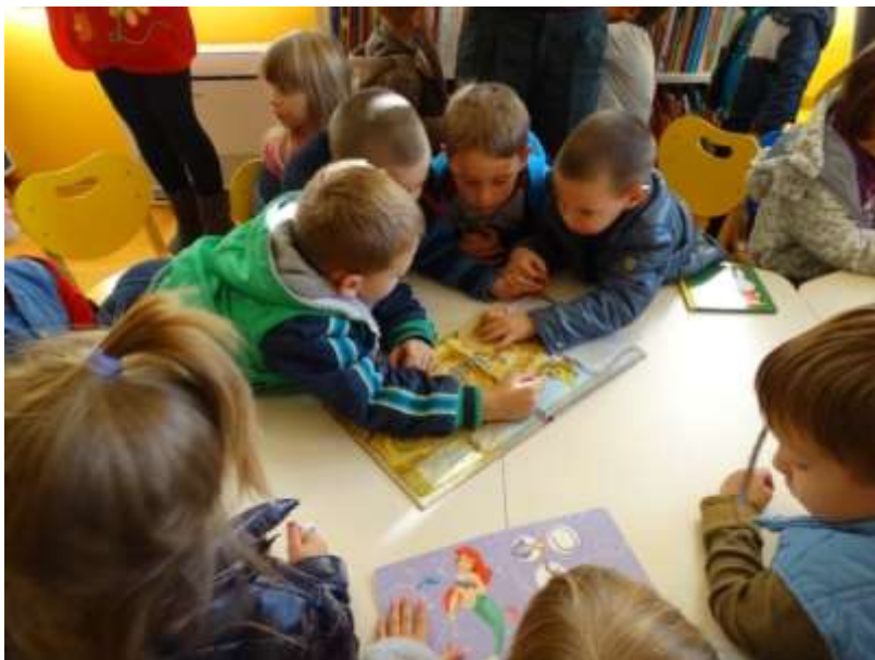
Posjet djece iz DV Tamaris

Knjižnica stalno surađuje s ustanovama i udrugama kako bi osigurala što bolju kvalitetu usluge. Uz stručnu suradnju s drugim knjižnicama, posebno se može istaknuti suradnja s Dječjim vrtićem Tamaris (sastanci, sudjelovanje u projektima, privremeni smještaj najmlađe vrtičke skupine, posjeti u Mjesecu knjige i slično), Osnovnom školom Vodice (sudjelovanje u projektima, posjeti u Mjesecu knjige), Gimnazijom Antuna Vrančića na projektu Animacija demokracije, Grupom za potporu dojenja Sunce moje malo koji su svoje sastanke održavali upravo u multimedijalnoj dvorani Knjižnice, Turističkom zajednicom Vodice na projektu prvih vodičkih Bakanalija, Udrugom maslinara i uljara grada Vodice u organizaciji Fešte od uja i predavanja, Centrom za socijalnu inkluziju Šibenik, Klubom dragovoljnih davatelja krvi Vodice, Odsjekom za francuski jezik i književnost Odjela za francuske i iberoromanske studije, Sveučilišta u Zadru, uz stalno pozivanje korisnika na suradnju.