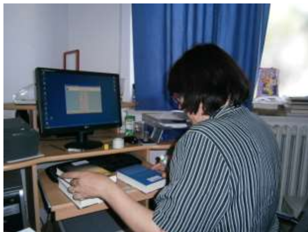
Knjižnica u OŠ Vodice