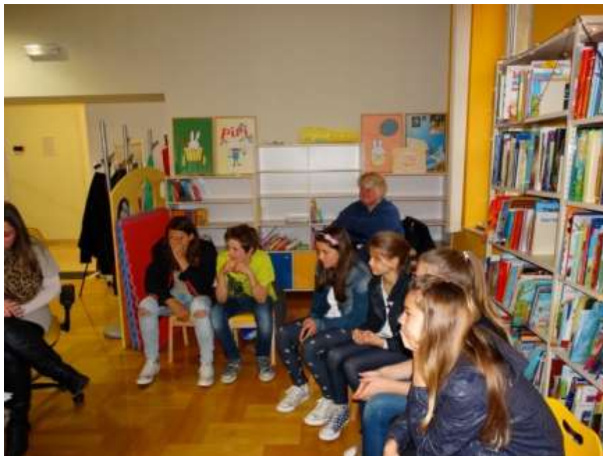
Noć knjige na Odjelu za djecu i mlade