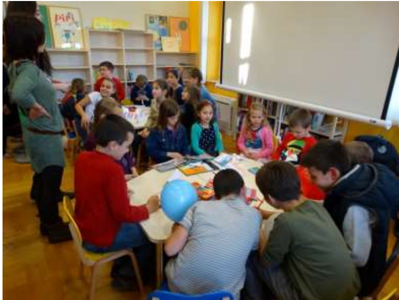
Promotivni sat projekta Upoznajmo Francusku i francuski jezik

U suradnji s Odsjekom za francuski jezik i književnost Odjela za francuske i iberoromanske studije, Sveučilišta u Zadru u 2014. godini planiran je projekt Upoznajmo Francusku i francuski jezik za djecu od šeste do desete godine života. Cilj projekta je upoznavanje s francuskim jezikom i kulturom. Promotivni sat održan je 20. ožujka ove godine i polučio je veliki interes djece i roditelja, no početak projekta je odgođen iz financijskih razloga.