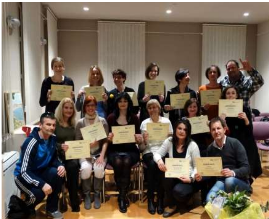
Prvi uspješni polaznici škole znakovnog jezika Želim te razumjeti

Projekt Želim te razumjeti nastao je krajem 2013. godine u suradnji s Udrugom gluhih i nagluhih osoba Grada Vodica kao škola znakovnog jezika koju je uspješno položilo petnaest polaznika. Suradnja s udrugom se nastavlja i dalje kroz organizaciju budućih škola znakovnog jezika.