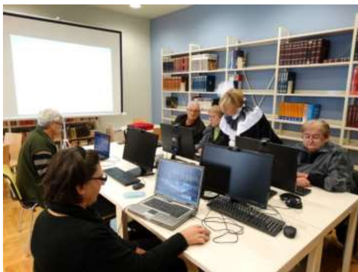
Radionica Informatika 50+

Početkom godine Knjižnica je pozvala umirovljenike da se uključe u besplatnu radionicu osnova računalnog opismenjavanja s ciljem smanjivanja digitalnog jaza među generacijama. Interes je bio velik i u dva turnusa radionicu je pohodio 31 umirovljenik.