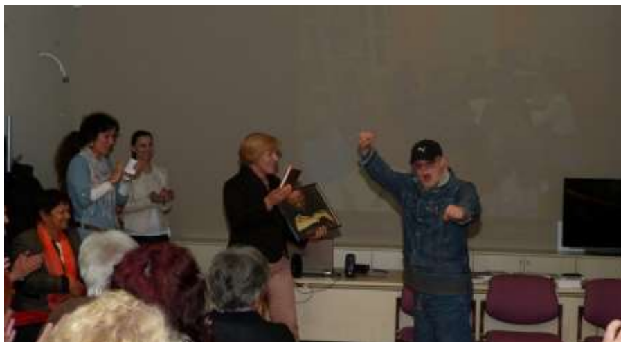
Dodjela nagrade za najbolju fotografiju „Čitatelja“

U Knjižnici je 2014. godine prvi puta održana Noć knjige , manifestacija kojom obilježavamo Svjetski dan knjige i autorskih prava, s ciljem poticanja kulture čitanja i podizanja svijesti o važnosti knjige. U multimedijalnoj dvorani uz interpretaciju pjesme Ne diraj moju ljubav na znakovnom jeziku polaznica škole znakovnog jezika, klapu Oršulice i poeziju zavičajnih pjesnika, dodijeljene su nagrade za najbolji literarni rad na temu Božićni ugođaj u mome gradu te za najbolju fotografiju natječaja Čitatelj .