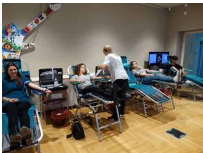
Akcija dobrovoljnog davanja krvi