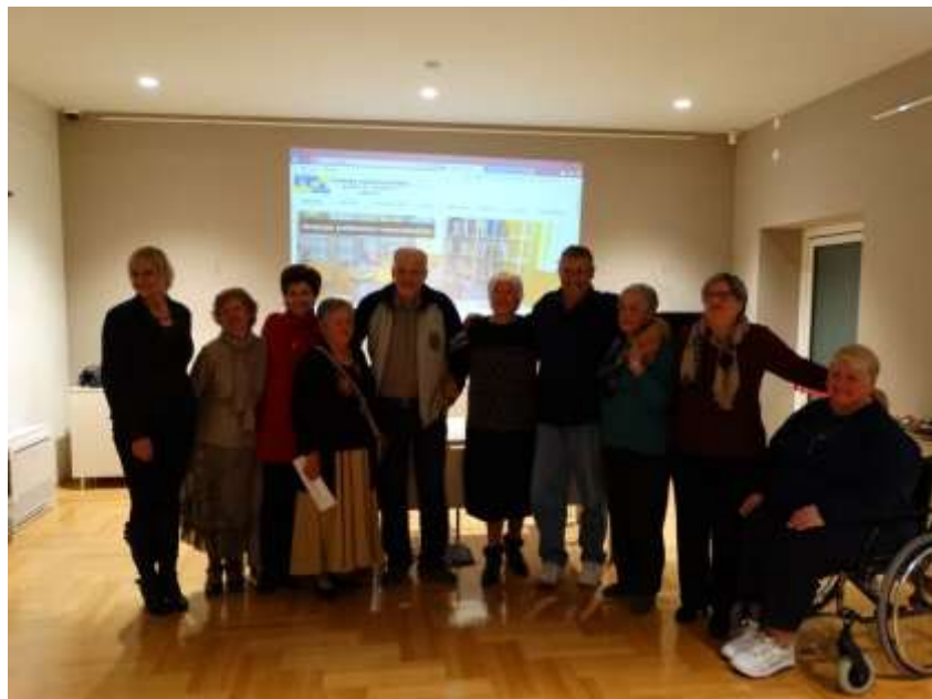
Pjesnici Večeri ljubavne poezije

Mjesec hrvatske knjige 2014. bio je u znaku ljubavi pa se i u našoj Knjižnici organizirala večer ljubavne poezije lokalnih pjesnika koji su po drugi put ove godine imali priliku pokazati svoje pjesničko umijeće.