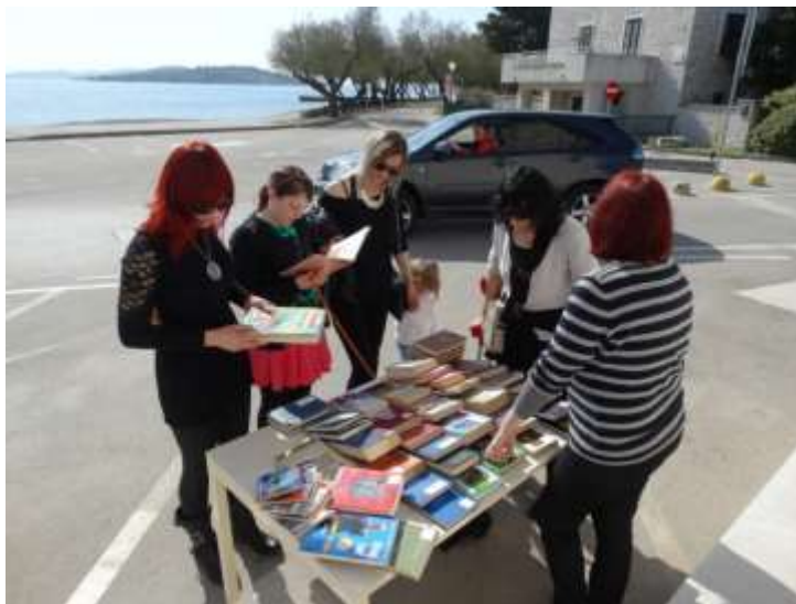
Humanitarna prodaja otpisanih knjiga