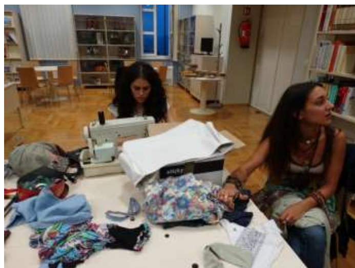
Radionica šivanja hipi odjeće