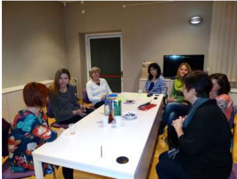
Prvi sastanak Kluba čitatelja