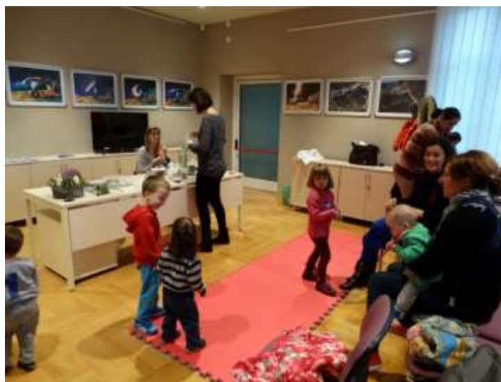
Sastanak GPU Sunce moje malo