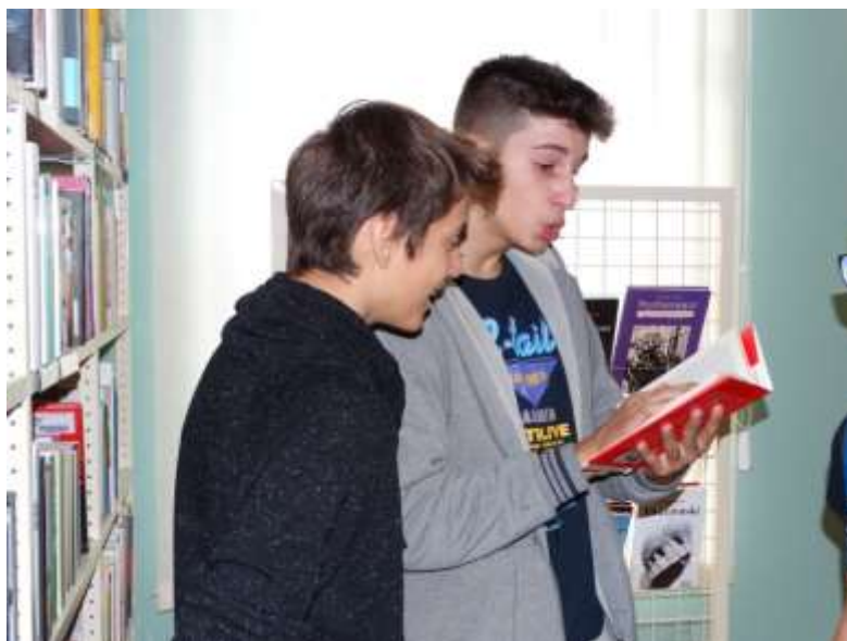
Posjet učenika iz OŠ Vodice