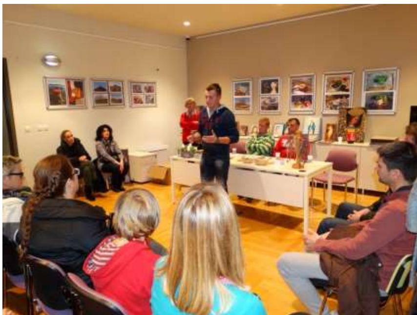
Svjedočanstvo momka iz zajednice Cenacolo

U prepunoj multimedijalnoj dvorani momci iz zajednice Cenacolo, iz kuće Jankolovica kod Biograda prenijeli su svoja svjedočanstva o borbi s ovisnosti. Govorili su o odnosima u svojim obiteljima, s okolinom i prijateljima i o odluci odlaska u zajednicu te o životu u zajednici. Svi su posjetitelji mogli humanitarno pomoći djelovanju zajednice kroz kupnju njihovih rukotvorina i donacijom higijenskih potrepština.